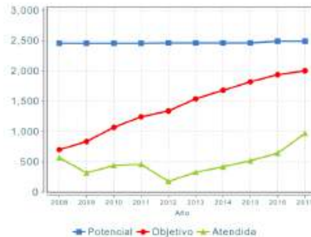
Gráfica 1.- Evolución de la cobertura del PFTPG