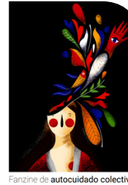
Fanzine de autocuidado colectivo “El deseo de imaginar y producir colectivamente otros mundos y reproducir nuestros valores en ellos”