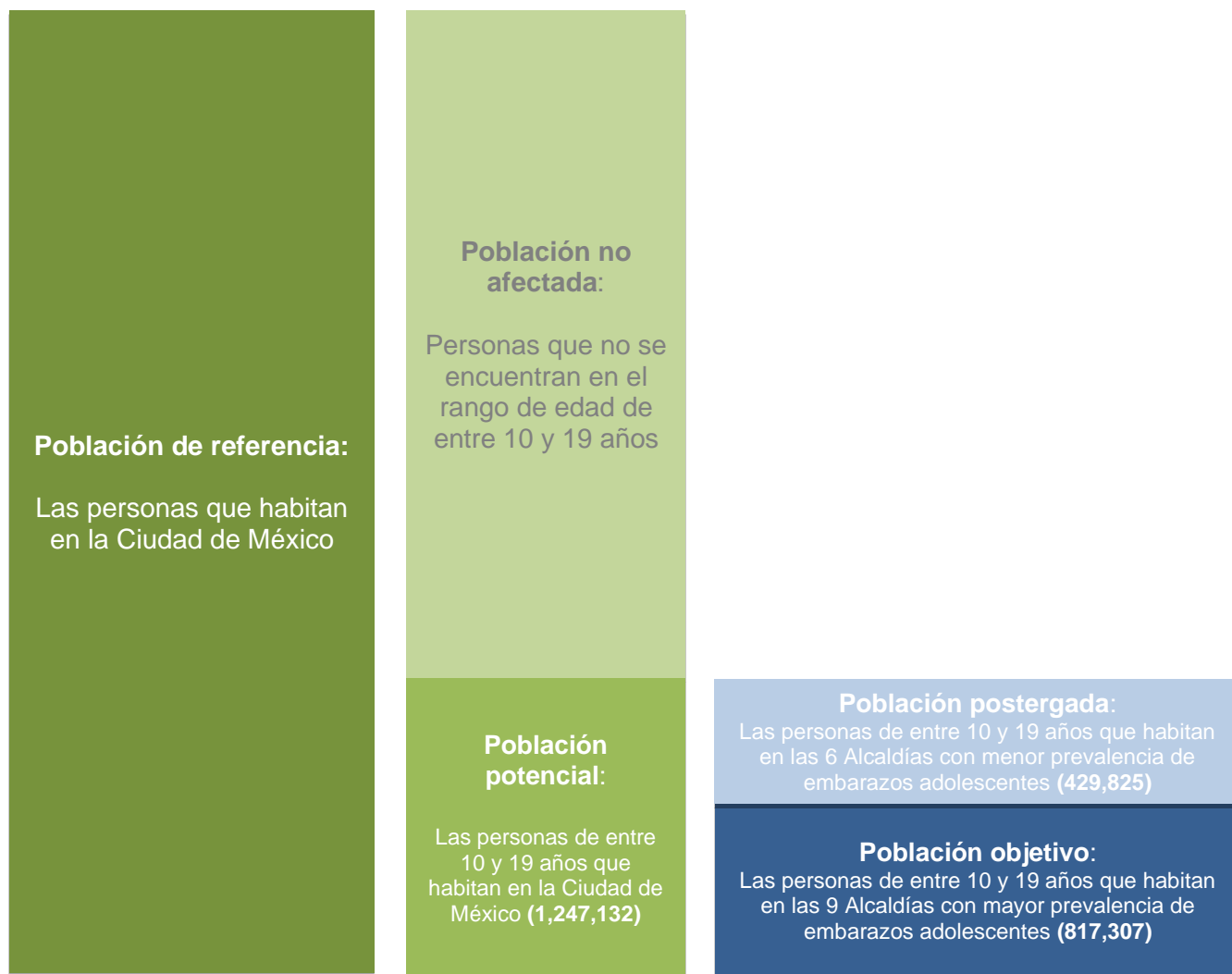
Figura 2. Propuesta de poblaciones

INMUJERES se consideró esta como la cobertura geográfica a donde el programa realizaría sus acciones.