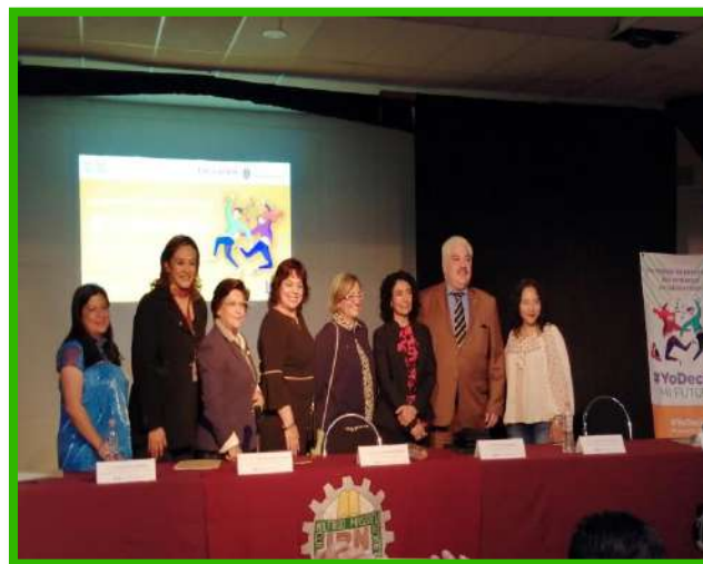
Sede: Cecyt 11 "Wilfrido Massieu" Alcaldía Miguel Hidalgo. Fecha: 3 de Octubre de 2019