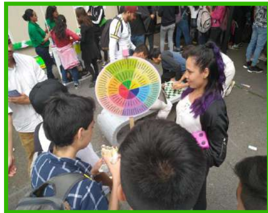
Feria de servicios en plantel educativo