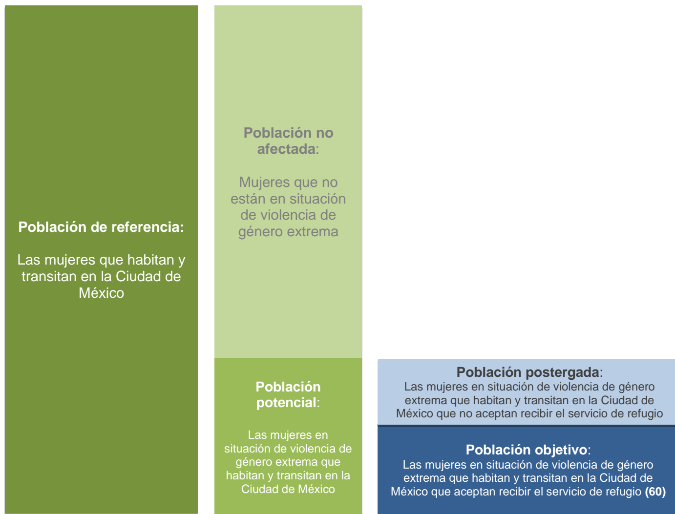
Figura 2. Propuesta de poblaciones

2018 se atendieron a 60 mujeres y cabe precisar que en el refugio se atiende a la totalidad de mujeres ( y en su caso con sus hijas e hijos) que solicitan los servicios.