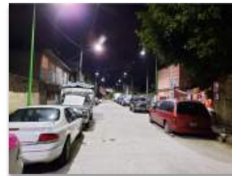
Colonia Los Reyes, Alcaldía Iztacalco