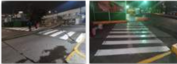
CETRAM Pantitlán pasos seguros