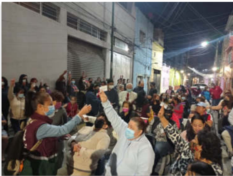
Asamblea Vecinal en la Alcaldía Miguel Hidalgo