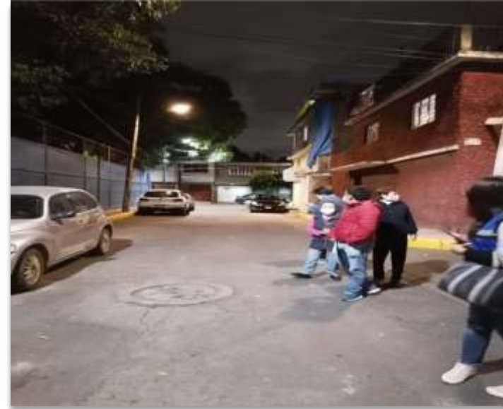
COLONIA TEZOZOMOC ALCALDÍA AZCAPOTZALCO 21TB- AZC- 17