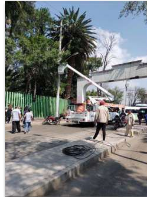
CETRAM Deportivo Xochimilco mantenimiento de iluminación