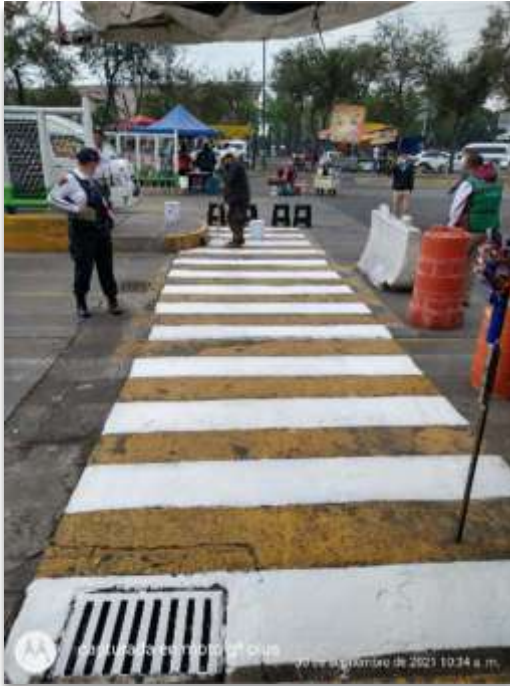
CETRAM San Lázaro pasos seguros