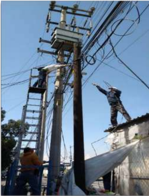
CETRAM Martín Carrera mantenimiento iluminación