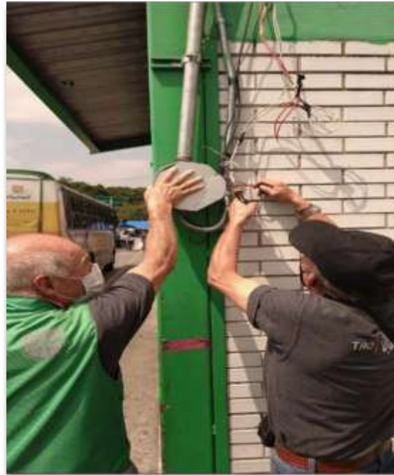
CETRAM Tacubaya mantenimiento de iluminación