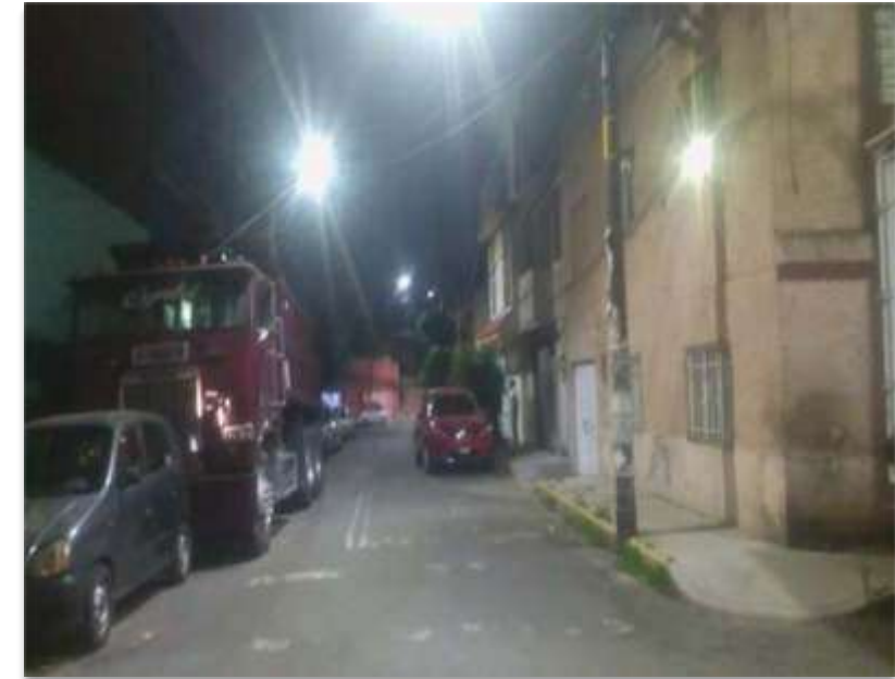
COLONIA CERRO DE LA ESTRELLA ALCALDÍA IZTAPALAPA 21TB- IZP-09