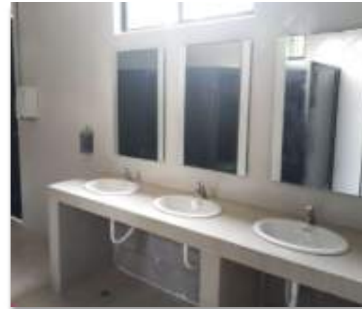
CETRAM COYUYA construcción de módulo sanitario nuevo