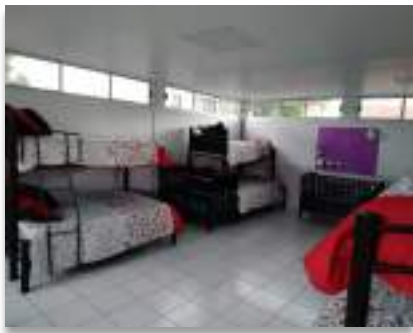
Casa de Pernocta