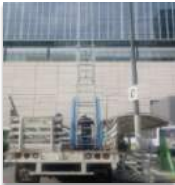
CETRAM BARRANCA DEL MUERTO revisión de luminarias en andenes