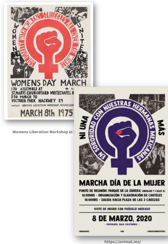
Womens Liberation Workshop in

Tras la Segunda Guerra Mundial, la conmemoración del 8 de marzo tomó protagonismo en muchos países, pero no fue sino hasta 1975, coincidiendo con el Año Internacional de la Mujer, que la Asamblea General de las Naciones Unidas conmemoró por primera vez esta fecha. En 1977 se institucionaliza la conmemoración, pero la pauta de su celebración viene dada por las organizaciones y movimientos de mujeres en todo el mundo.